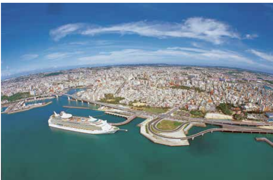
写真-1 那覇港クルーズ船ターミナルと那覇市街