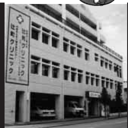
陽心会 辻町クリニックデイケア