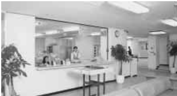
外来受け付けロビー

この度、「大道中央病院ニュース」を地域の皆様にお届けすることになりました。 陽心会を紹介することにより、地域の皆様方の健康により一層の対応が出来る様に存じます。 当会は県都那覇市の中心部に大道中央病院を開設、内科、外科を中心に外来を365日オープンし、一般的な治療を十分に 行える体制を整備した上で 県内の専門医療の一翼を担うべく、消化器、糖尿病に力を入れてお ります。救急医療に 関しても「病は時を選ばない」との認識で、より身近なところで、より早く適切な医療を「目 を」を24時間対応