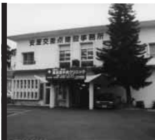
陽心会 真和志中央クリニックデイケア

デイケアに通うお年寄り地域交流 が、広がっています。壺屋小学校は昨年 来、道徳教育の一環としてデイケアの 老人と触れあう授業を実施し、児童に いたわりの心（優しさ）、してあげるこ との喜び（ボランティア）を知らせまし た。 交流会では焼き物を共同製作したり、 音楽発表などが行われ、貴重な成果が 得られました。 お年寄りから「またきて欲しい」、児 童からは「この交流会は私たちもお年 寄りたちもうれしくなる交流会だった」 という声が聞かれました。 陽心会はこのような地域との交流に も積極的に協力していく考えです。