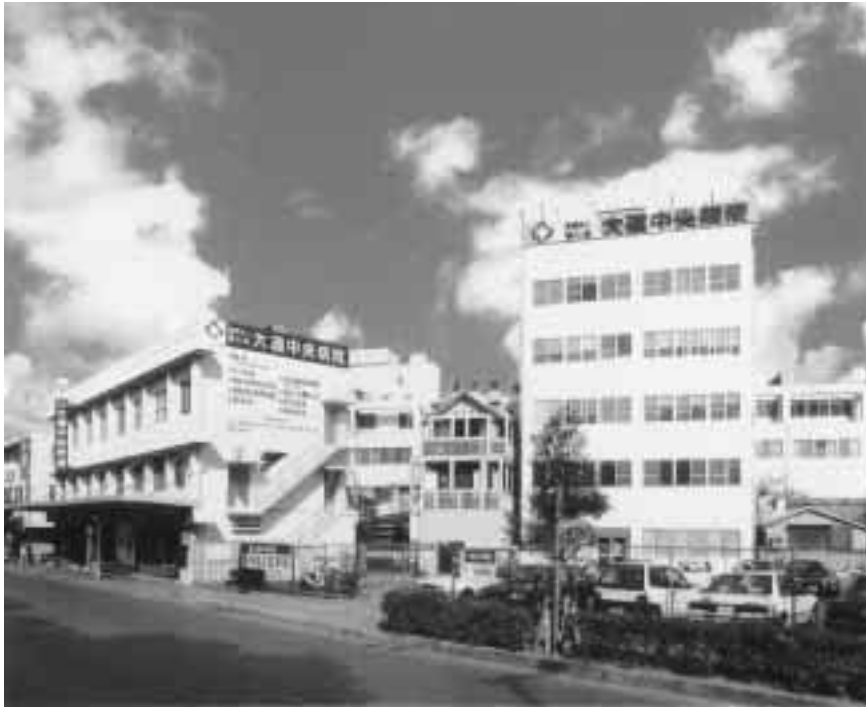
大道中央病院外観

時間指しを 24時間 対応 を「目 を」を 医療 な医療 早く適 切 るで、 より 近など この認 識 で、よ り身 選ばな い 「病は 時を 関して も 急医療 に ります 。救 入れて お 病に力 を 化器、 糖尿 うべく 、消 一翼を 担 門医療 の 県内の 専門医 療の を十分 に 行える 体制を 整備 した上 で 県内の 専門医 療の 一翼を 担 うべく 、消 化器、 糖尿 病に力 を 入れて お ります 。救 急医療 に 関して も 「病は 時を 選ばな い との認 識 で、よ り身 近など この認 識 で、よ り身