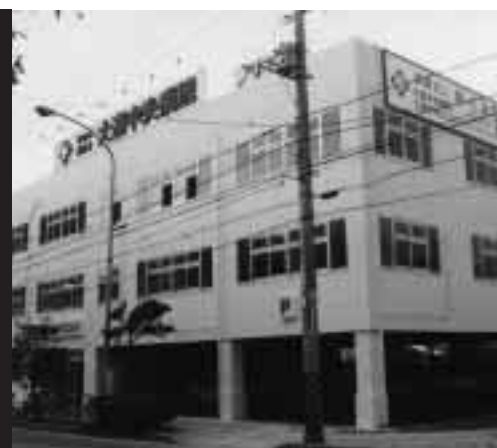
陽心会 大道中央クリニックデイケア